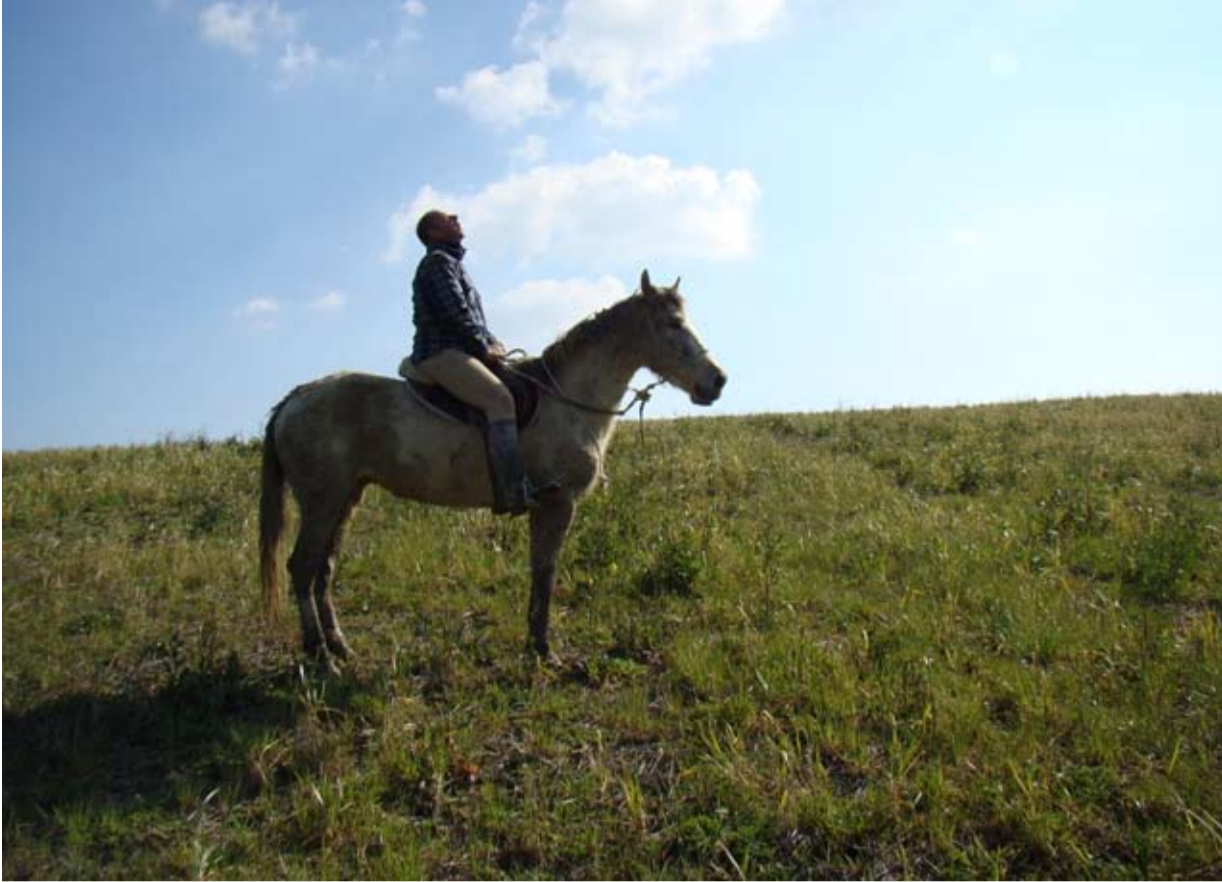
Altri momenti di vita con i cavalli